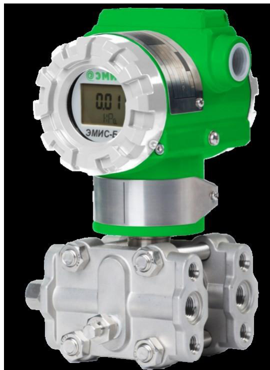
ЭМИС-БАР 105; ЭМИС-БАР 133; ЭМИС-БАР 143; ЭМИС-БАР 153; ЭМИС-БАР 193