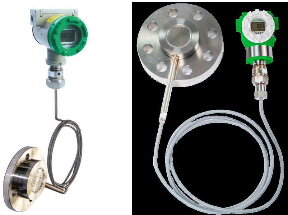
ЭМИС-БАР 173; ЭМИС-БАР 174; ЭМИС-БАР 175; ЭМИС-БАР 176