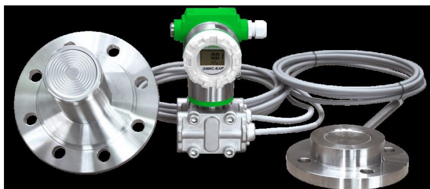
ЭМИС-БАР 183; ЭМИС-БАР 184; ЭМИС-БАР 185; ЭМИС-БАР 186; ЭМИС-БАР 187; ЭМИС-БАР 188