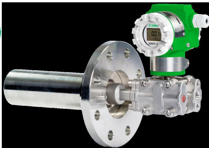
ЭМИС-БАР 163; ЭМИС-БАР 164