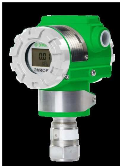
ЭМИС-БАР 103; ЭМИС-БАР 123