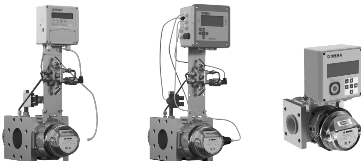
б) Общий вид счетчика (исполнения с вычислителем)