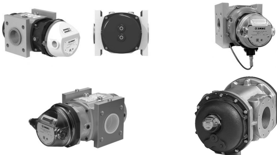
а) Общий вид счетчика (исполнения без вычислителя)