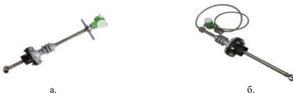
Рисунок 3 - Общий вид расходомеров-счетчиков вихревых «ЭМИС-ВИХРЬ 200» модификации ЭВ-205 (а. интегральное исполнение; б. дистанционное исполнение)