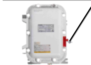
Рисунок 6 - Места нанесения защитных пломб